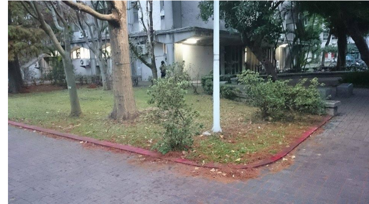
預定立牌位置現場照片