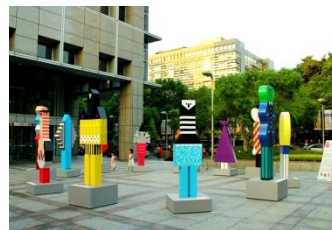
管理學院二號館 戶外廣場： Séverin Millet 作品 (10件) 作品：《人間浮世繪》