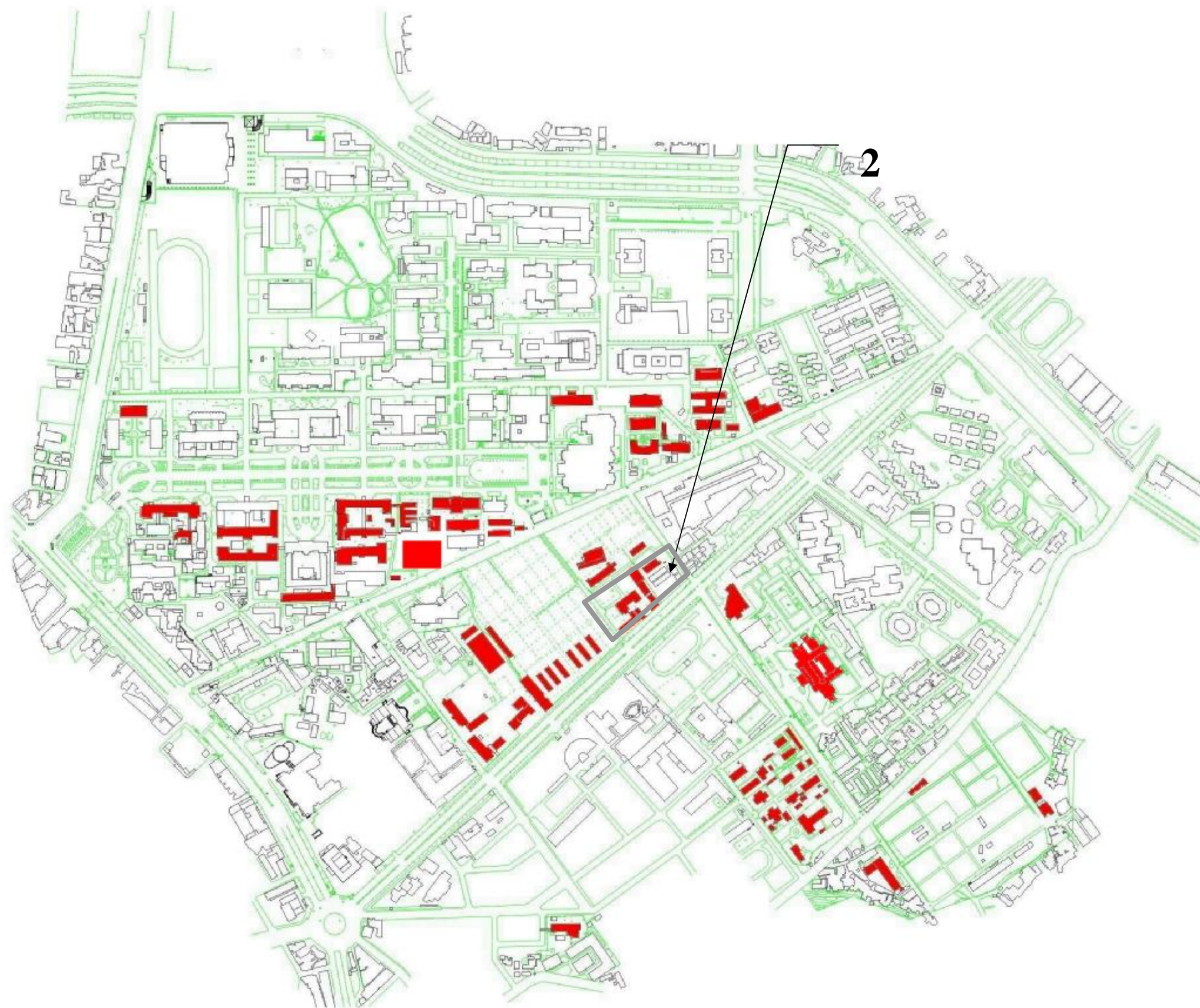
圖 4.6-3 農學院長程空間發展計畫預定區位

動物醫院已完成，原有之家畜醫院舊有房舍建議予以拆除，做為興建教學研究大樓，以提供為未來成立受醫學院之空間需求。