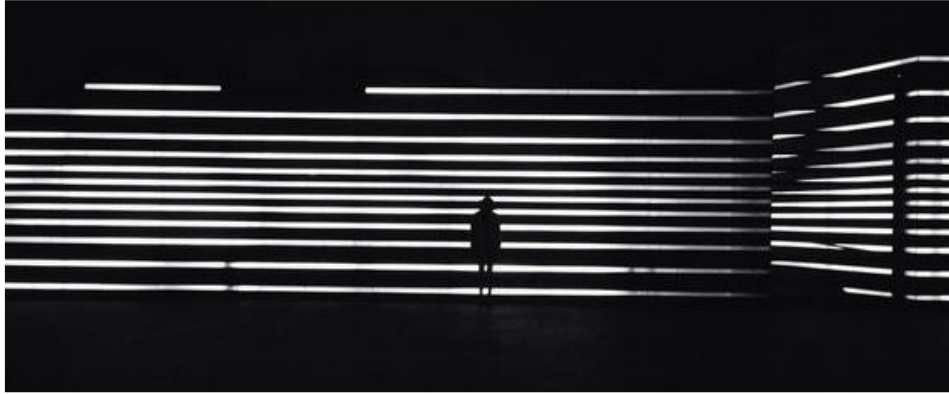
圖1 外牆設計語彙示意圖