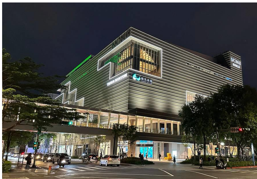
圖 A2 NOKE 忠泰樂生活夜間照明

於2023年4月開幕後成為大直最具代表的新，設計靈感以基地最重要的「地理位置」為目標，建物本體使用乾淨的白色，於夜間僅純粹以LED燈做為襯托其建築物的照明。本案設計亦透過LED燈光，將本身具特色之「新月台」照亮，讓純粹的磚色、十三溝磚之溝縫陰影展現出來，重新成為臺灣大學重要的「地標」。