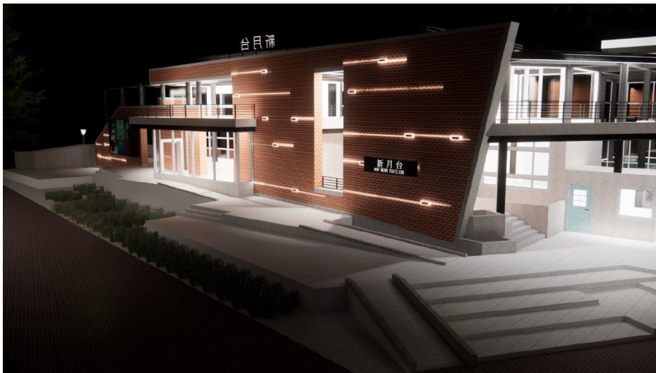
圖 4 夜間立面示意圖-1