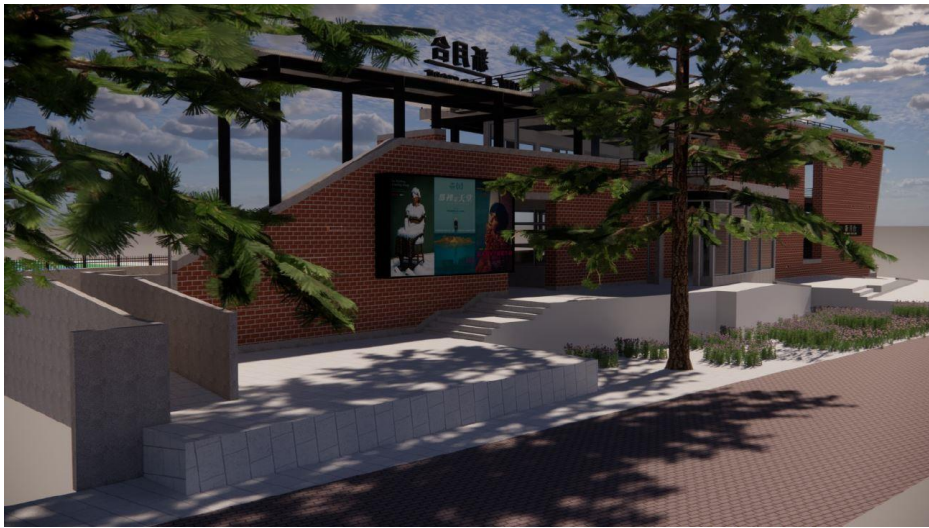
圖 3 日間立面示意圖