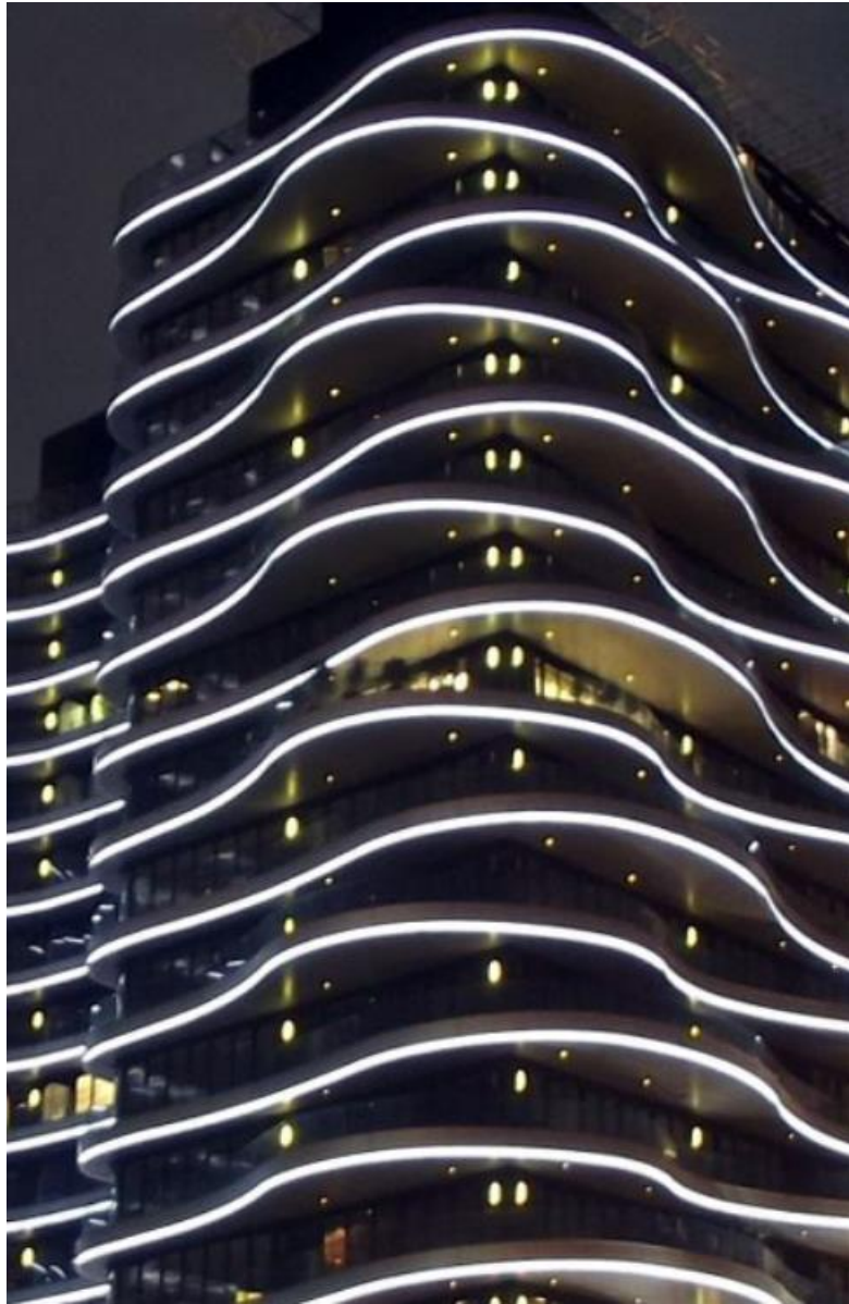
圖 A1 大隱海納川夜間照明

參考其因建築本身的曲線立面，透過LED燈光於夜間照亮，讓日、夜都能感受建築律動的線條設計。將其帶入本次設計，使本案最具特色之十三溝磚，於夜間被照亮，並展現溝縫所呈現的光影之美。