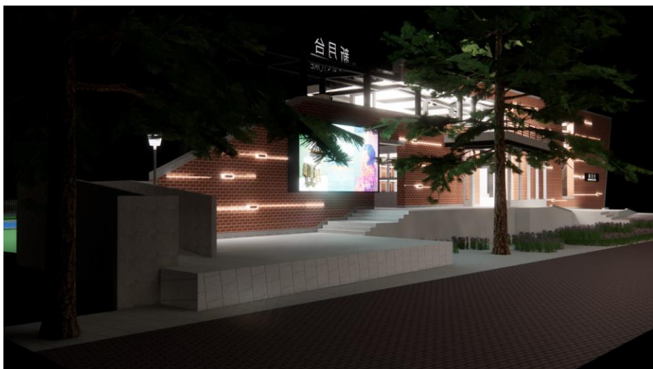
圖 5 夜間立面示意圖-2